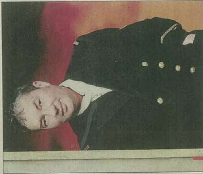
Znorko fouille dans la mémoire des habitants de la région avec son projet sur le tunnel du Rove.

En savoir plus, La Gare Franche, 7 chemin des Tuilleries (15 e ), Marseille, 04 91 65 17 71, www.cosmoskolej.org