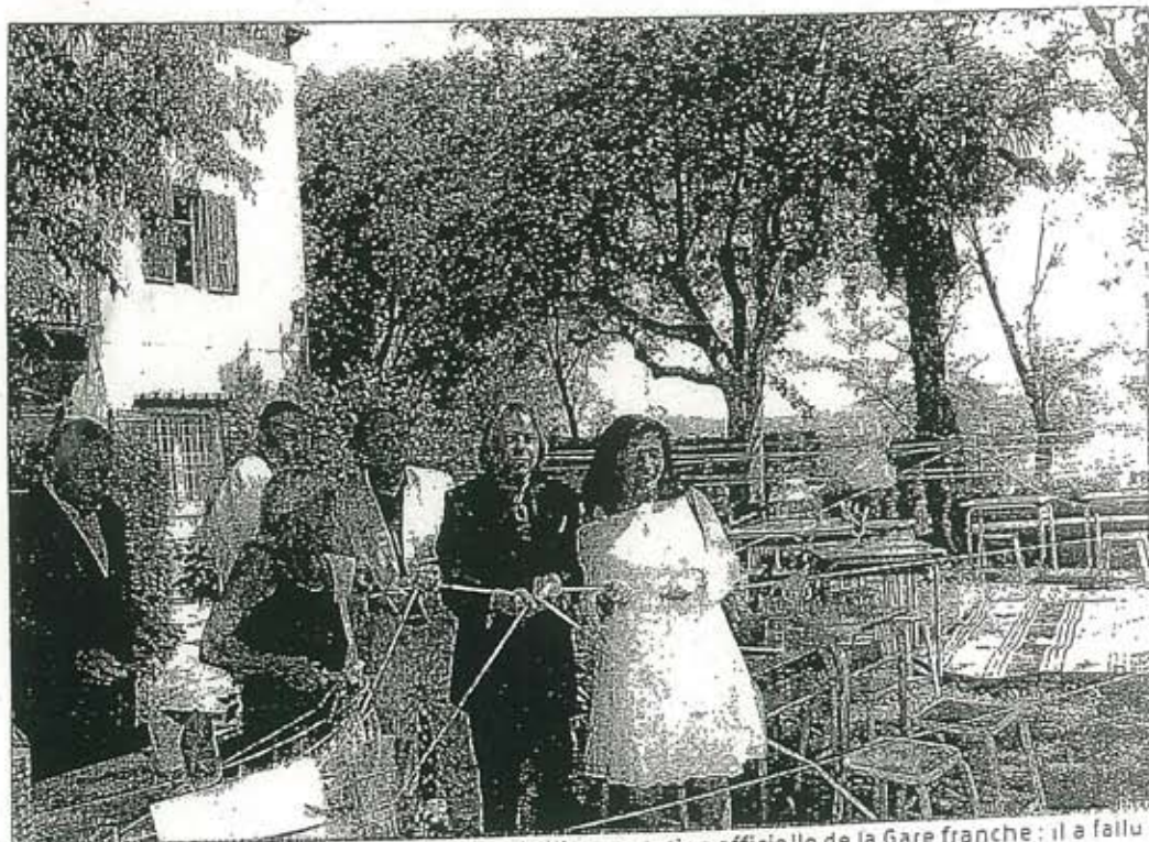
► Une originale séance de ruban coupé, lors de l'inauguration officielle de la Gare franche : il a fallu aux élus jouer des ciseaux sur une véritable toile d'araignée tendue dans le jardin.